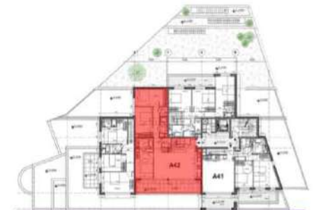
SURFACE APPT A42

27 AVENUE DES VALLÉES - 74200 THONON LES BAINS - FRANCE